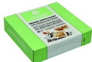
ORESTO Wener appeltaart 12 porties - portions Tarte viennoise aux pommes 1,8 kg