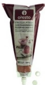
ORESTO Amb. chocolademousse met 100% Belgische fondant chocolade Mousse au chocolat artisanale au chocolat fondant 100% belge 1,3 kg