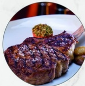
Steak tomahawk 1 rib - côte Origine: Ierland/Irlande Ref. 10116155