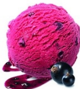
MÖVENPICK Blackcurrant sorbet 2,4 L