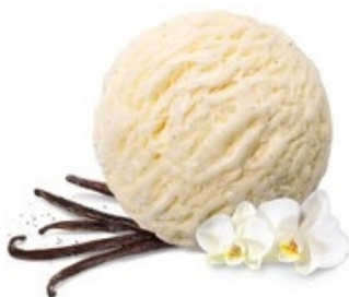
MÖVENPICK Vanilla dream 2,4 L