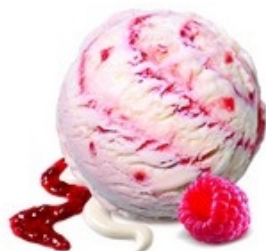
MÖVENPICK Panna cotta 2,4 L