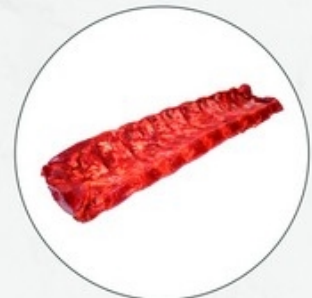
Gemarineerde varkens spare ribs bbq Spare ribs de porc bbq mariné Ref. 10116335 1 st/pce - ±480 g