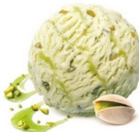
MÖVENPICK Pistachio 2,4 L