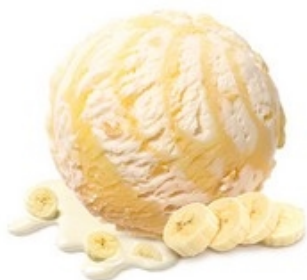
MÖVENPICK Banana 2,4 L