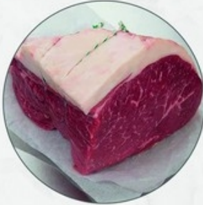
Topside Ierse Hereford Topside Hereford irlandais ±4 kg Ref. 10110202