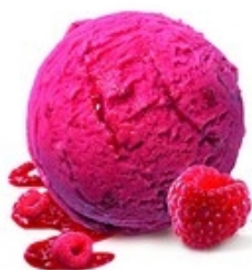
MÖVENPICK Raspberry sorbet 2,4 L