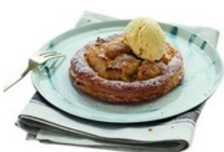
ORESTO Appeltaartje Tartelette aux pommes Ø13,5 cm 12x170 g