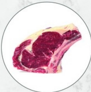
Ierse runderrib Côte à l'os boeuf irlande Origine: Ierland/Irlande Ref. 10116118 ±1 kg