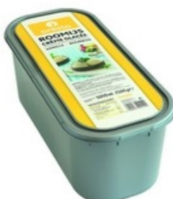
ORESTO Roomijs Crème glacée vanille Bourbon 5 L