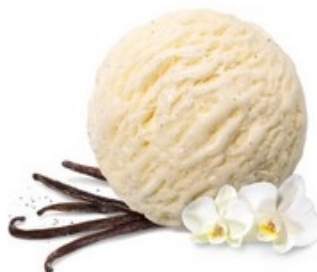
MÖVENPICK Vanilla dream 5 L