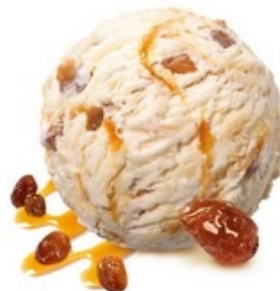
MÖVENPICK Rum-rozijnen Rhum-raisins 2,4 L