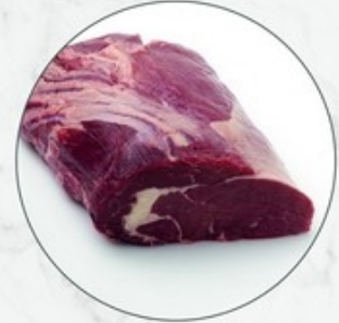
Tussenrib cubroll Noix entrecôte cubroll Origine: Ierland/Irlande Ref. 10110212 ±3,5 kg