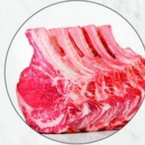
Rundskroon Couronne de bœuf black angus - 5 ribben/côtes Origine: Ierland/Irlande Ref. 10110209